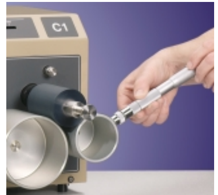
Farbauftrag mit der IGT-Farbpipette

Die Bedruckbarkeitsprüfgeräte C1 bestehen aus einem Einfärbe- und einem Druckteil mit einer abnehmbaren Druckscheibe (Druckform). Das Einfärbegerät besteht aus zwei Aluminiumwalzen und einer Oberwalze. Die Farbverteilung dauert aufgrund des Durchmesserhältnisses und der Bewegung der Walzen nur 30 Sekunden. Die Einfärbezeit der Druckscheiben beträgt 15 Sekunden. Für verschiedene