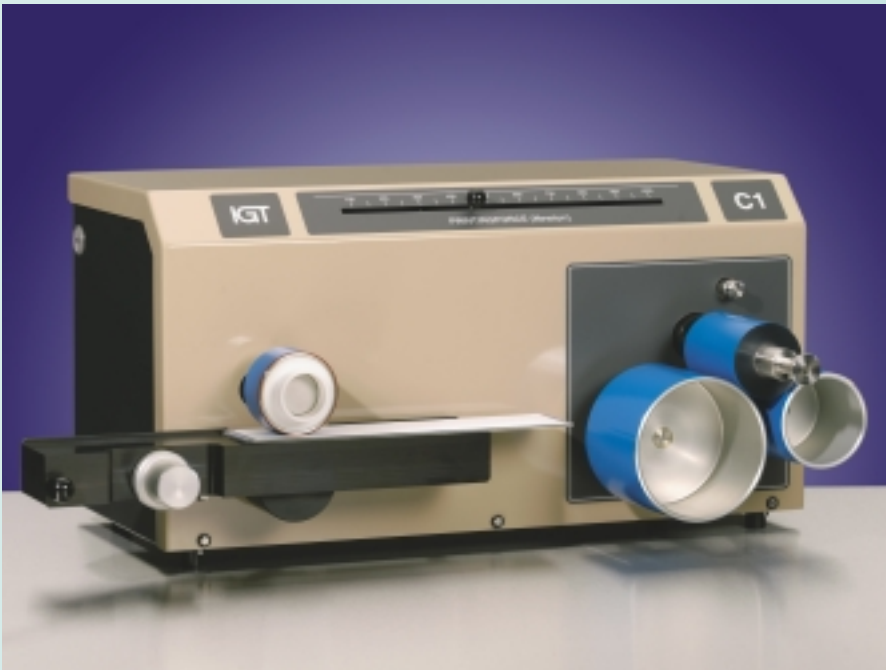
Anfertigen eines Ausdrucks

Papier, Pappe, Kunststoff-Folie, Zellophan, Lamine, Blech, usw.