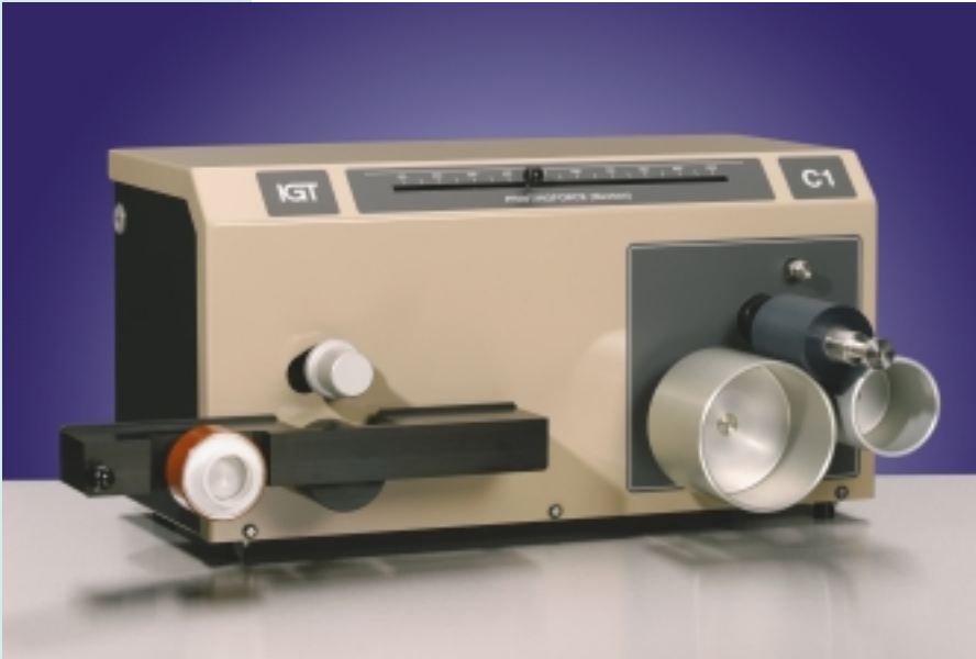
Das Prüfgerät C1, betriebsbereit