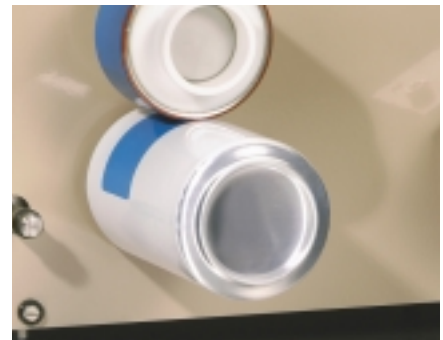
Anfertigen eines Ausdrucks auf einer Blechdose

Die Standard-Druckscheibe für konventionelle Farben weist einen Belag aus beschichtetem Gummi auf oder ist mit Gummituch bezogen. Ferner stehen auch Scheiben mit Gummibelag oder Gummibezug für UV-Trocknende Farben zur Verfügung. Außerdem ist eine Druckscheibe mit Aluminium Oberfläche erhältlich. Das Gewicht der Druckscheiben ist < 200 g, so dass sie auf Analyse-